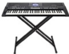
CLAVIER ELECTRIQUE/ SAMPLEUR