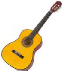
GUIWARE (CLASSIQUE, ELECTRIQUE)